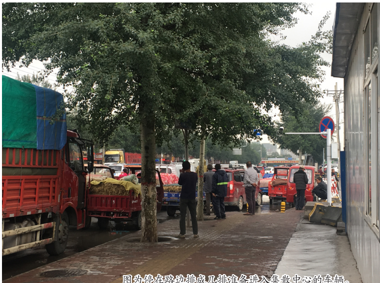
图为停在路边排成几排准备进入集散中心的车辆。