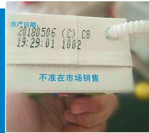
图为家长提供的过期牛奶包装盒。

近日,有一些家长致电晚报热线反映,孩子在幼儿园的一次加餐中饮用了过期牛奶,有点担心孩子的健康受到影响,希望晚报记者予以关注。