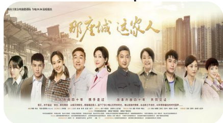
大地震后重组七姓九口之家