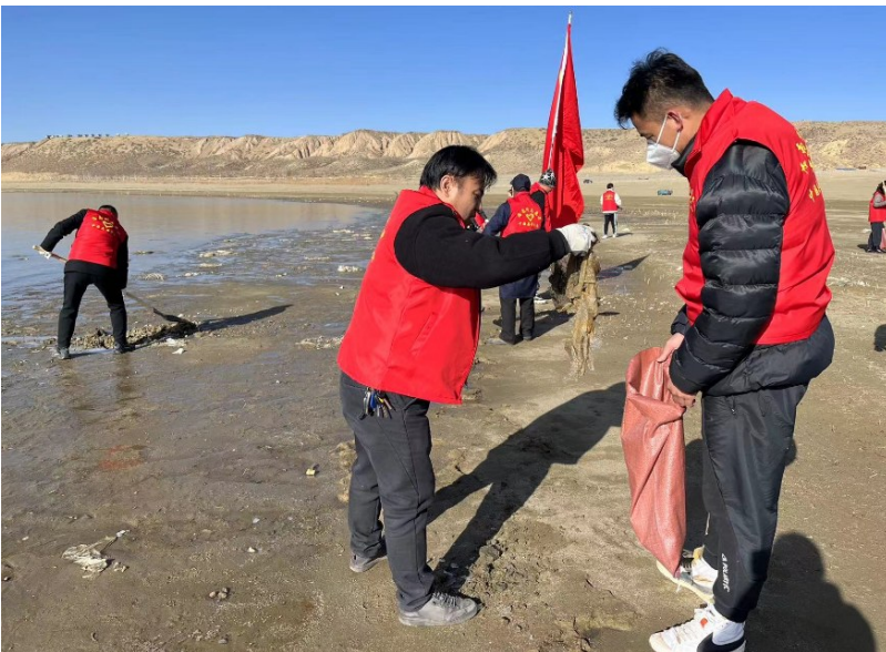
3月4日,海南藏族自治州举行“清洁海南”常态化学雷锋志愿服务行动启动仪式,为“清洁黄河”“清洁青海湖”、文明交通、文明旅游4支志愿者服务队授旗。当天,5万余名志愿者分赴黄河岸边、青海湖南岸和景区景点等重点区域开展清洁行动。