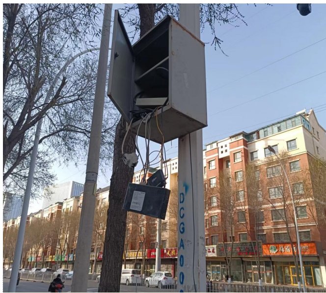
4月26日,有市民反映,青海民族大学东墙附近公安部门安装在电线杆上的监控设施被损坏,箱内的交换机、电源插座、电源线等设施裸露在外,存在安全隐患。

近日,有市民致电晚报热线反映,城中区前营街、后营街,城南同安路(奉西路至同安路),城北美丽水街都在进行封闭施工,封闭施工给市民的出行带来不便,市民想知道这些路段何时能施工完毕?