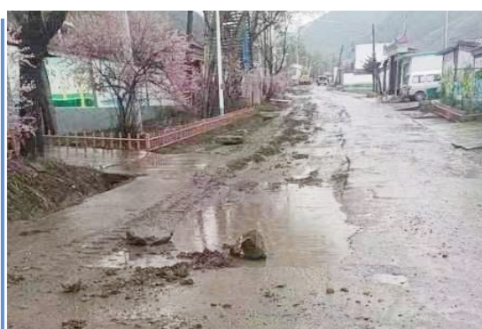
图为大通县上庙村坑洼不平的道路。

5月7日,大通县桥头镇上庙村的村民致电本报交通热线反映,该村通往桥头镇的一条必经之路破损严重且泥泞不堪,已经有一年时间了,村民出行非常不便,希望晚报予以关注。