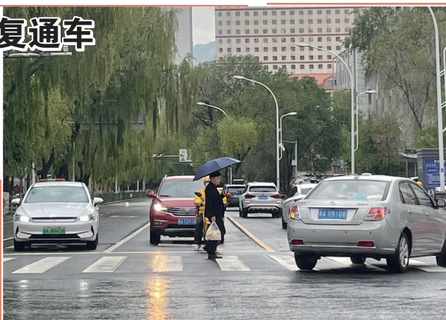
图为南大街(南山路至昆仑中路)恢复通车的情景。