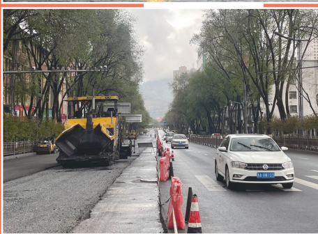
图为南大街(夏都大街至大十字)西半幅路面正在施工,预计6月3日完工通车。