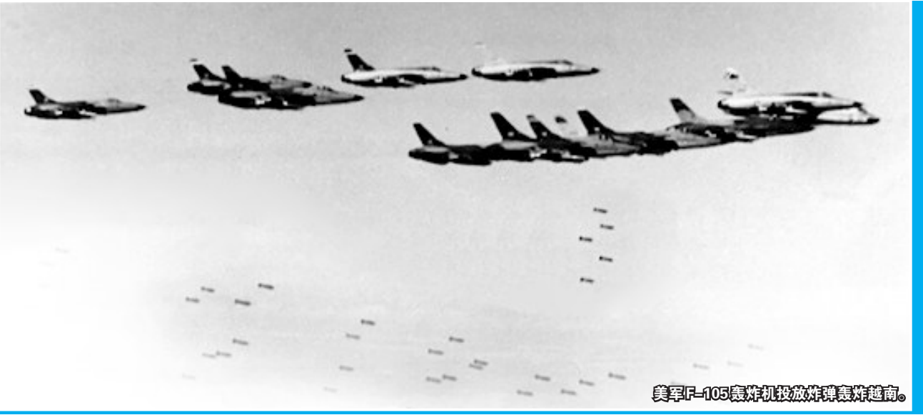
美军B-52轰炸机投放炸弹轰炸越南。

因遗留的炸弹太多，老挝甚至出现新职业——炸弹回收。一些当地人经常开玩笑，“拜美国所赐，我们穷得只剩下炸弹了”，“别人是靠山吃山，我们是靠炸弹吃炸弹”。已爆炸弹壳体碎片、未爆炸弹等都是炸弹回收从业者的“生存来源”。回收的炸弹金属材料多数流入越南的加工厂，变成建筑业所需