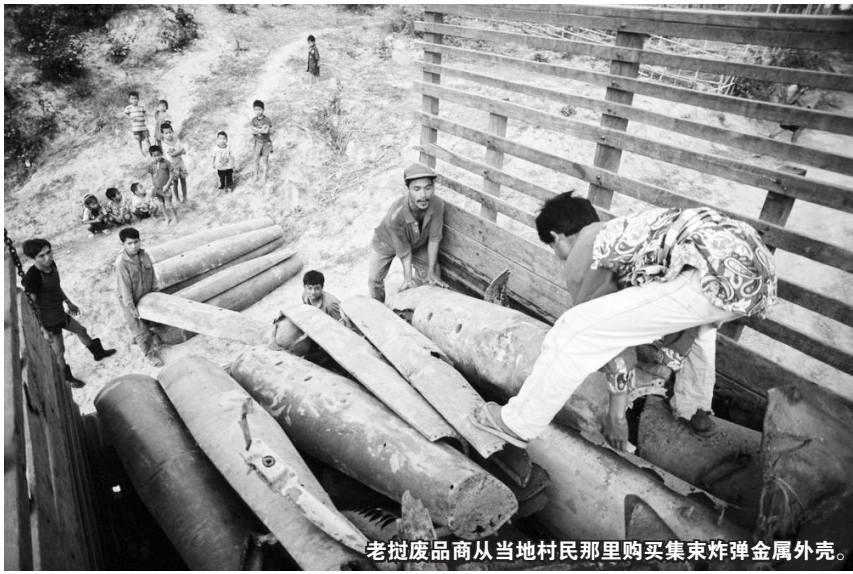
老挝废品商从当地村民那里购买集束炸弹金属外壳。