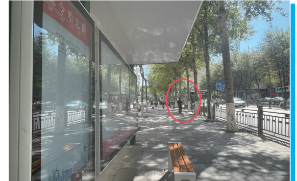
图为德令哈北路公交站亭前护栏无缺口,无法启用的情景。