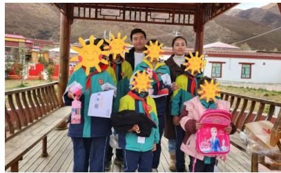
本版文字编辑 晴空

下一步,班玛团县委将加大对困境青少年的帮扶支持力度,持续关注青少年的学习和生活,努力营造全社会关注关心关爱困境青少年的良好氛围。