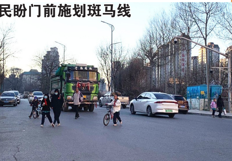
图为刘家寨小区门口人车抢道的情景。

12月1日下午,记者来到刘家寨小区门口看到,这里正好是109国道和昆仑西路的交叉路口,车流量人流量都很大,记者采访时正好赶上了文苑路小学放学时间,孩子们从昆仑西路文苑路口穿过斑马线之后,沿着人行道一路向东走到109国道与昆仑西路的交叉路口处横穿马路,在短短的10分钟时间内,有四五十个孩子在这个交叉路口横穿马路,他们有的踩着滑板车在路上滑行,家长跟在孩子后面追赶,有的在路上嬉戏打闹,有的则背着书包在车流中穿梭,因这个交叉路口由西向东方向是一个下坡路段,车速较快,经过的车辆看到横穿马路的孩子们后,不得不采取措施紧急避让,刹车声此起彼伏。采访当日,记者将存在的问题分别反馈到城西区城乡建设局和市城乡建设局,并将行人横穿马路的照片和视频一并传送。