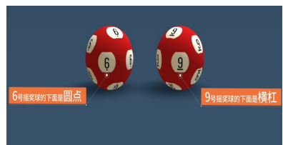
(双色球摇奖球的“6”号球和“9”号球)

答:摇奖球上的“6”和“9”也是有区分的。双色球摇奖球和七乐彩摇奖球,采用点和线的元素区分“6”号摇奖球和“9”号摇奖球,也就是“点六杠九”,“6”号摇奖球的数字底部是圆点,“9”号摇奖球的数字底部是横杠;快乐8和福彩3D摇奖球,“6”号摇奖球和“9”号摇奖球的数字底部均为横杠。