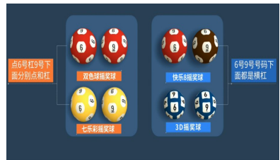
(福彩摇奖球的“6”号球和“9”号球)