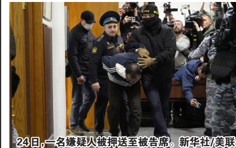
24日，一名嫌疑火被押送至被告席。