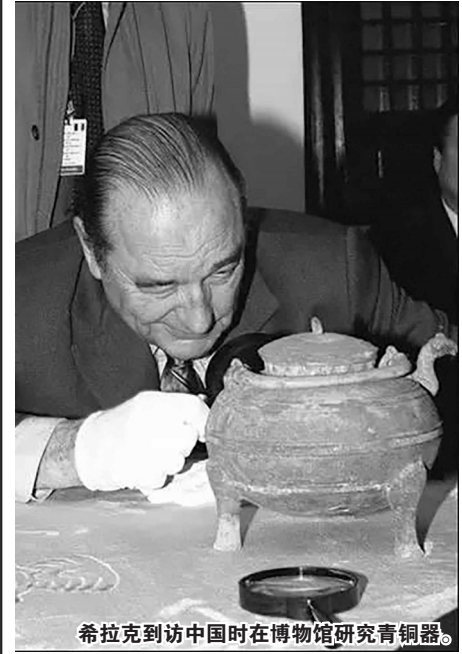
希拉克到访中国时在博物馆研究青铜器。

长大后的希拉克也没有因为政务繁忙而放弃这一年少时的爱好。据希拉克夫人回忆，希拉克当选总统之后，每晚睡前都会阅读中国考古方面的期刊。1997年访华时，希拉克特别要求去上海博物馆参观青铜器。在参观时，他与青铜器专家就每一个展品细节深入讨论，以至于推迟专机起飞时间，足见其对青铜器和中国文化的着迷。