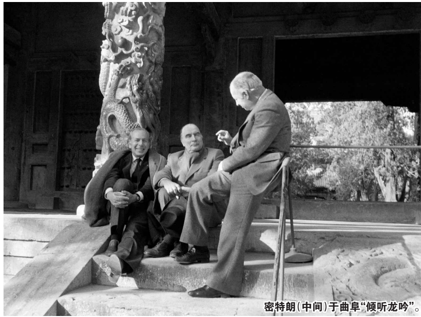
密特朗（中间）于曲阜“倾听龙吟”。

希拉克曾说：“我本人十分景仰有着最古老最丰富文明的中国，我爱中国。”在总统任内，希拉克曾多次发起有关中法文化交流的活动。卸任后他也长期致力于促进中法两国的友好关系，推动中法两国的文化交流。2019年，希拉克在巴黎逝世，中方在唁电中表示深切的哀悼：“他的不幸逝世是法国和法国人民的重大损失，中国人民也失去了一位老朋友、好朋友。”