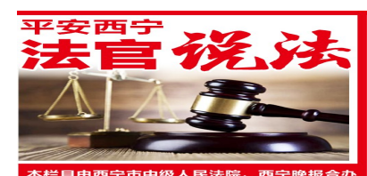
本栏目由西宁市中级人民法院、西宁晚报合办