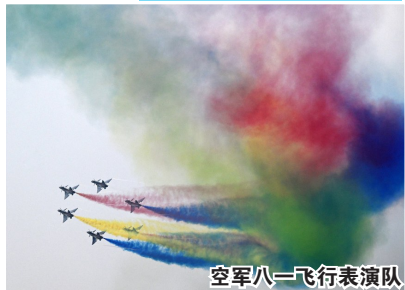
空军八一飞行表演队

海军航展期间将以静态展示方式展出歼-15T舰载战斗机、直-9F反潜直升机、运-8反潜巡逻机等多型现役主战机型。在飞行表演环节，歼-15系列飞机、直-20J直升机等将演示伙伴加油、空中突击等内容。军事专家宋心之说：“歼-15弹射型的舰载机首次公开展示，它实际上向全世界宣布我国舰载弹射、舰载机的弹射改装技术都过关了。”