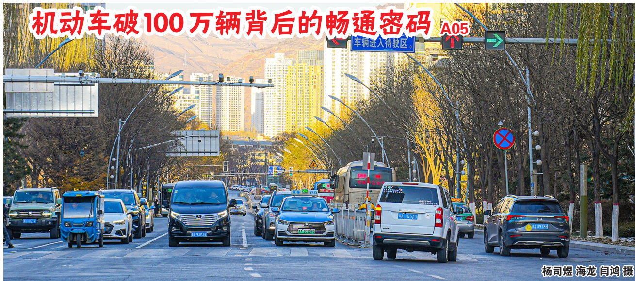
杨司煜 海龙 闫鸿摄