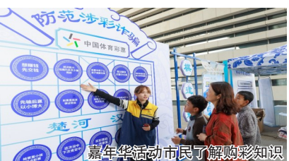
嘉年华活动市民了解购彩知识

彩知识！”一位参与互动的市民表示。这种寓教于乐的方式，不仅丰富了活动内涵，更展现了体彩作为国家公益彩票的社会责任与担当，现场理性购彩与反诈的宣传内容有效提