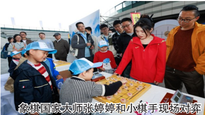
象棋国家大师张婷婷和小棋手现场对弈

作为连续举办7年的国家级民间赛事，本届棋王争霸赛兼具“全民性、草根性、场景下沉”的特点。赛事海选阶段覆盖全国7611家体彩店，吸引超3.01万名业余象棋爱好者