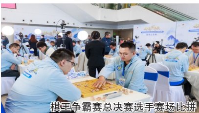
棋王争霸赛总决赛选手赛场比拼

从各地的体彩店海选赛到全国总决赛舞台，七年坚守中，体彩为无数棋友搭建了一个专业、开放的圆梦平台。它深入社区、扎根乡村，不仅让“民间棋王”的风采得以展现，更以体彩的公益属性为底色，助力象棋国粹的普及与传承，成为体彩践行“来之于民、用之于民”公益承诺、涵养国民文化自信的特色品牌。