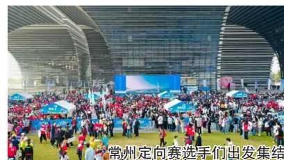
常州定向赛选手们出发集结

当“棋王们”在室内运筹帷幄、嘉年华活动如火如荼进行时，一场属于全城的趣味鸣枪——“发现常州”城市定向挑战赛同步鸣枪。作为近年来广受欢迎的新型全民健身赛事，定向赛吸引了超过5000名参赛者参与，路线设计别出心裁，巧妙融入了“象棋”主题任务，让参赛者在奔跑探索中，完成了一次对