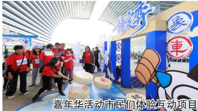
嘉年华活动市民们体验互动项目

在欢乐互动之余，现场购彩者权益保护专区也吸引了不少市民驻足。通过生动的展板内容和主持人的趣味问答，大家在轻松愉快的氛围中了解了理性购彩守护自己权益的重要性。“今天既玩了游戏，又了解了很多体