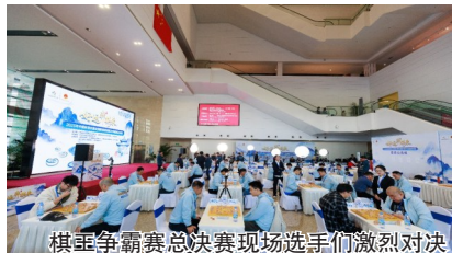
棋王争霸赛总决赛现场选手们激烈对弈

但这不仅仅是一场棋王“加冕礼”。中国体育彩票创新性地将全国象棋民间棋王争霸赛总决赛，与“发现常州”城市定向挑战赛、“棋聚民心”主题嘉年华深度融合，燃动常州，打造出一场“动脑博弈”与“动腿健身”相结合、竞技比拼与休闲娱乐相交融的城市级文体盛会，让体育消费自然融入市民周末生活，也彰显出体彩助力全民健身的公益初心。